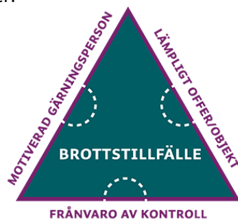
Figur 1. Förutsättningar för brott 6 .

Detta innebär att förebyggande arbete bör riktas mot en eller flera av dessa faktorer.